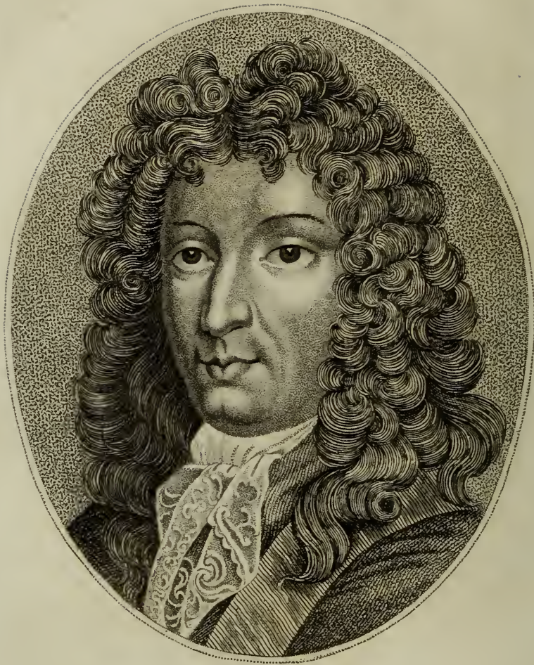
Le Comte DE GRAMMONT.